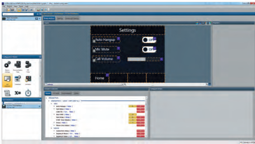
Extron DMP 128 C P 系统模板 - 设置屏幕

Extron DMP 128 C P 系统 • Biamp Audia/Nexia 系统 • Biamp Tesira 系统 • ClearOne Converge 系列 Polycom SoundStructure • Polycom HDX 9000 • Cisco SX20 or SX80 • Cisco C40, C60, or C90 Polycom Group • Lifesize Team • Starleaf 网真