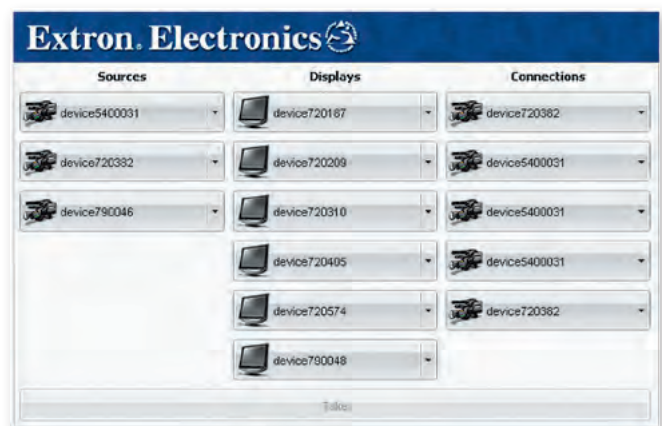
VNM EC 200 的切换器功能可用于将编码器的媒体流切换至解码器。

欲了解详细的技术参数，请访问 www.extron.cn 技术参数如有变化，恕不另行通知。